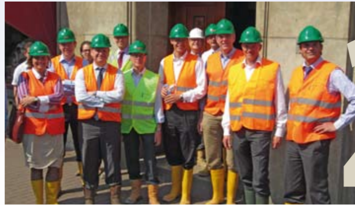
Programmaraad op bezoek bij de Noord/Zuidlijn in Amsterdam.